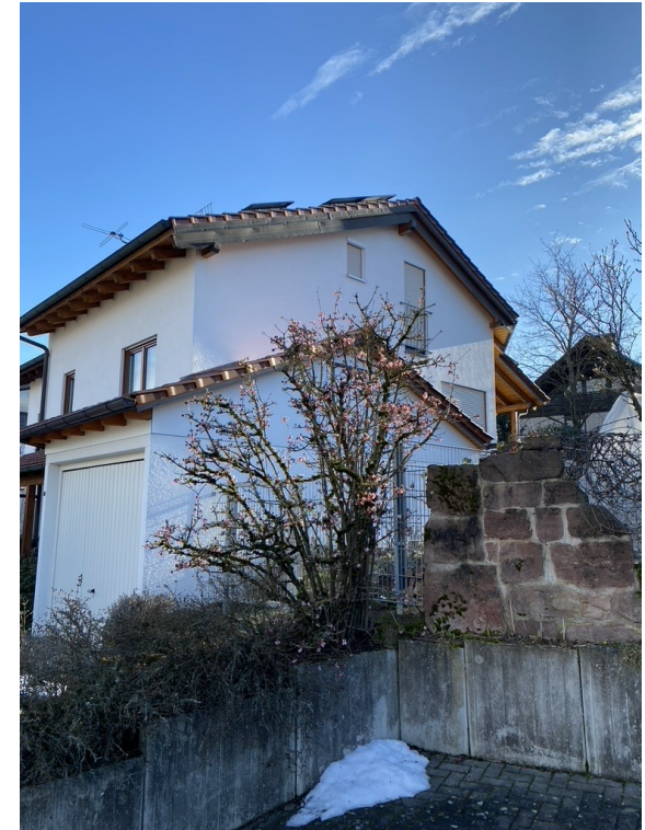
Haus von Westen, 20.01.2023